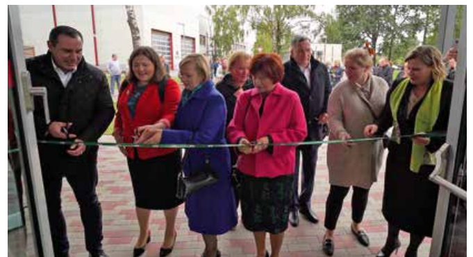
Svinīgo uzrunu teicēji pārgriež simbolisko Multifunkcionālās halles atklāšanas lentu