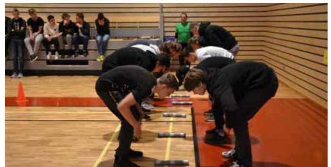
Jaunie audzēkņi adaptācijas pasākuma aktivitātēs