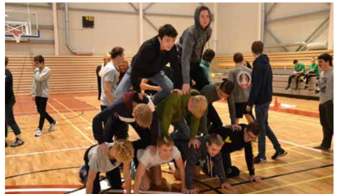
Jaunie audzēkņi adaptācijas pasākuma aktivitātēs