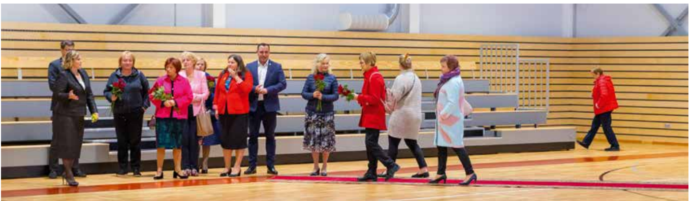
Svinīgā atklāšanas pasākuma viesi jaunajā sporta zālē