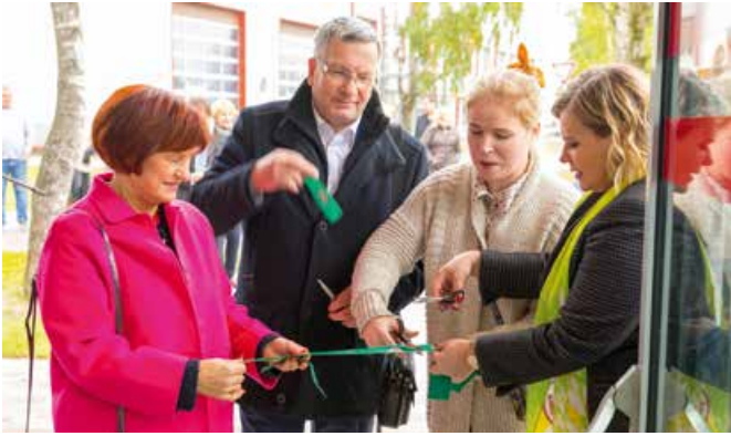
Svinīgo uzrunu teicēji pārgriež simbolisko Multifunkcionālās halle atklāšanas lentu