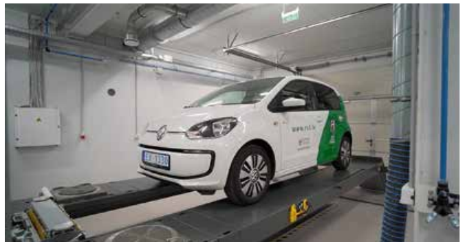
Auto nodaļas praktisko mācību telpas un darbnīca