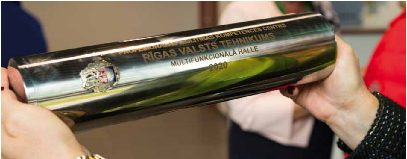
Laika kapsula ar vēstījumu nākamajām paaudzēm