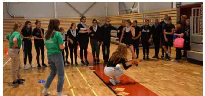
Jaunie audzēkņi adaptācijas pasākuma aktivitātēs